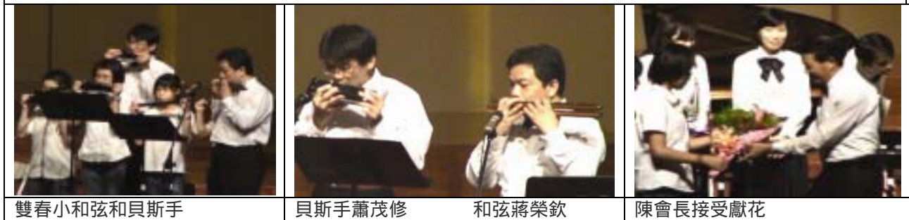
雙春小和弦和貝斯手