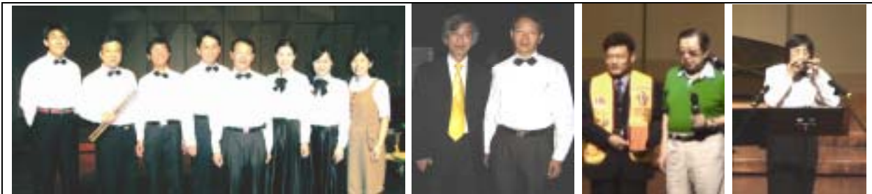
台灣複音口琴會演出後合影留念