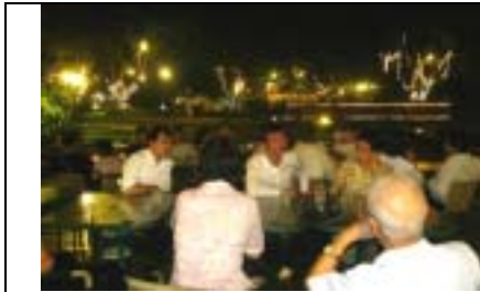
員林百果山銀河鐵道餐廳