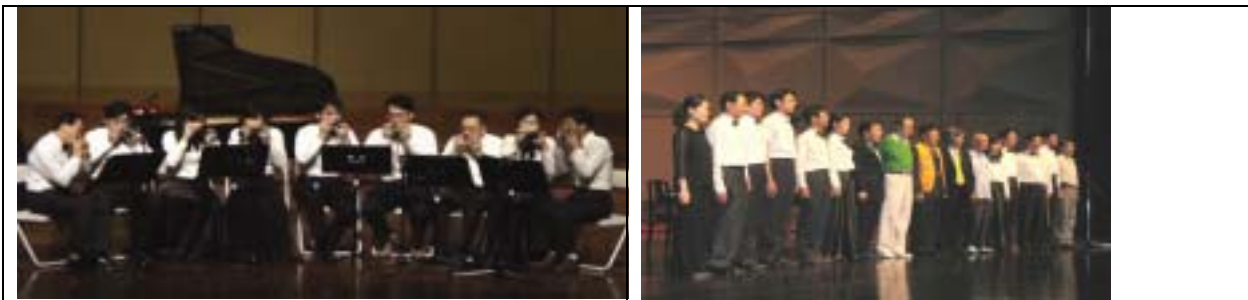
台灣複音口琴會演出：鬥牛士舞曲