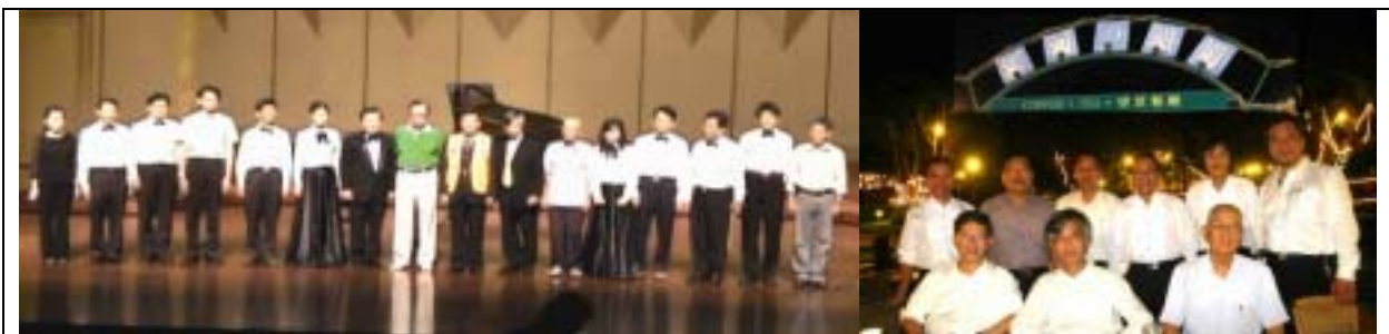
獅子會賴會長與全體合影