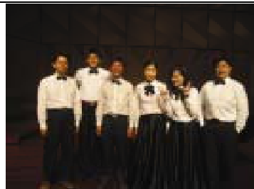
口琴家雜誌社全體